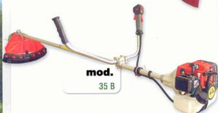
mod. 35 B