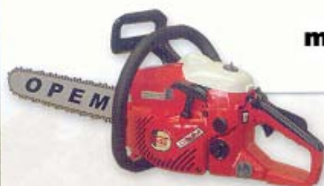
mod. S 42