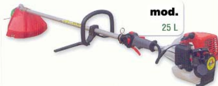
mod. 25 L