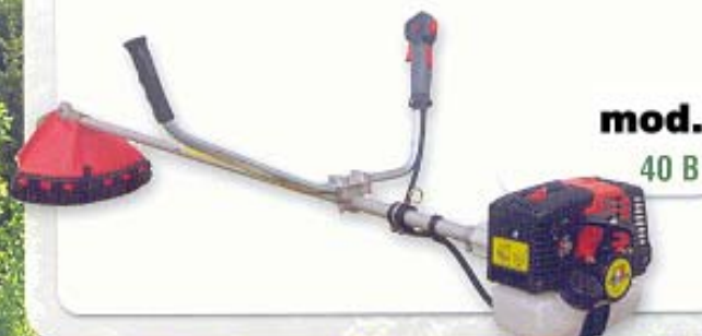
mod. 40 B