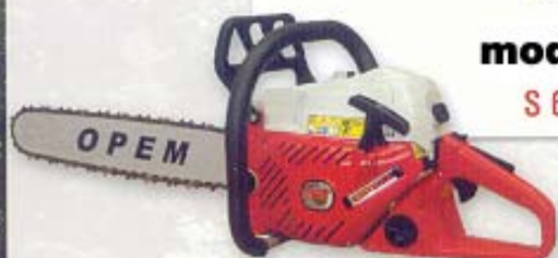
mod. S 63