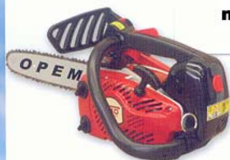
mod. S 40